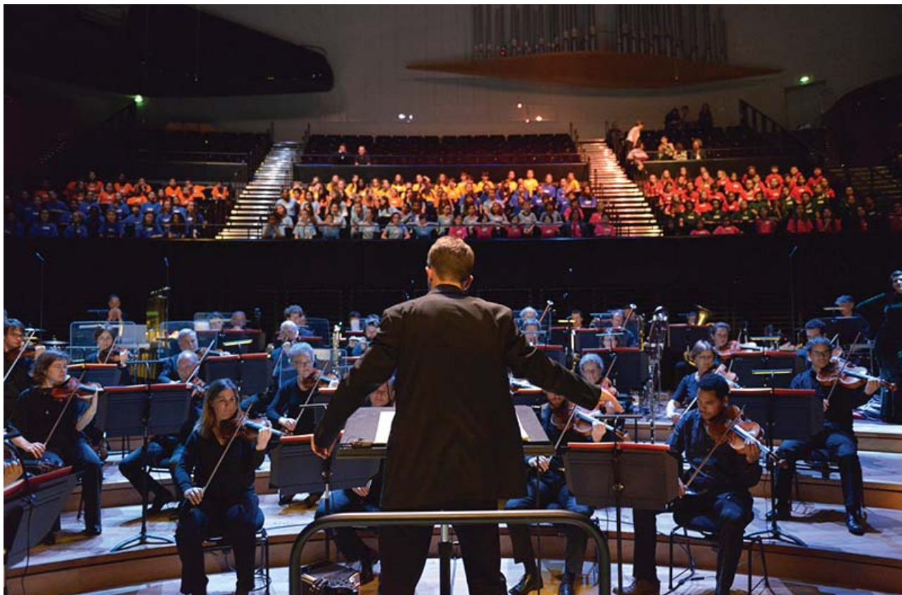
Alice au pays des merveilles, Chantons avec l'Orchestre, juin 2016