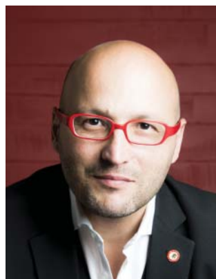
DIRECTEUR MUSICAL ET CHEF PRINCIPAL DE L'ORCHESTRE NATIONAL D'ÎLE-DE-FRANCE

DATES DES CONCERTS EN ÎLE-DE-FRANCE MARS 2017