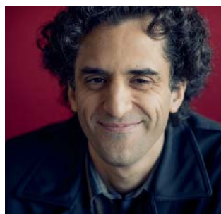
LAURÉAT DU CÉLÈBRE CONCOURS DONATELLA FLICK À LONDRES

— DATES DES CONCERTS EN ÎLE-DE-FRANCE FÉVRIER - MARS 2017