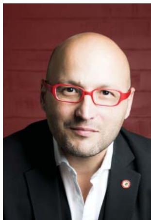
DIRECTEUR MUSICAL ET CHEF PRINCIPAL DE L'ORCHESTRE NATIONAL D'ÎLE-DE-FRANCE

DATE DES CONCERTS EN ÎLE-DE-FRANCE FÉVRIER - MARS 2017 PARMI LES DATES PROPOSÉES, CHOISISSEZ LA VÔTRE :